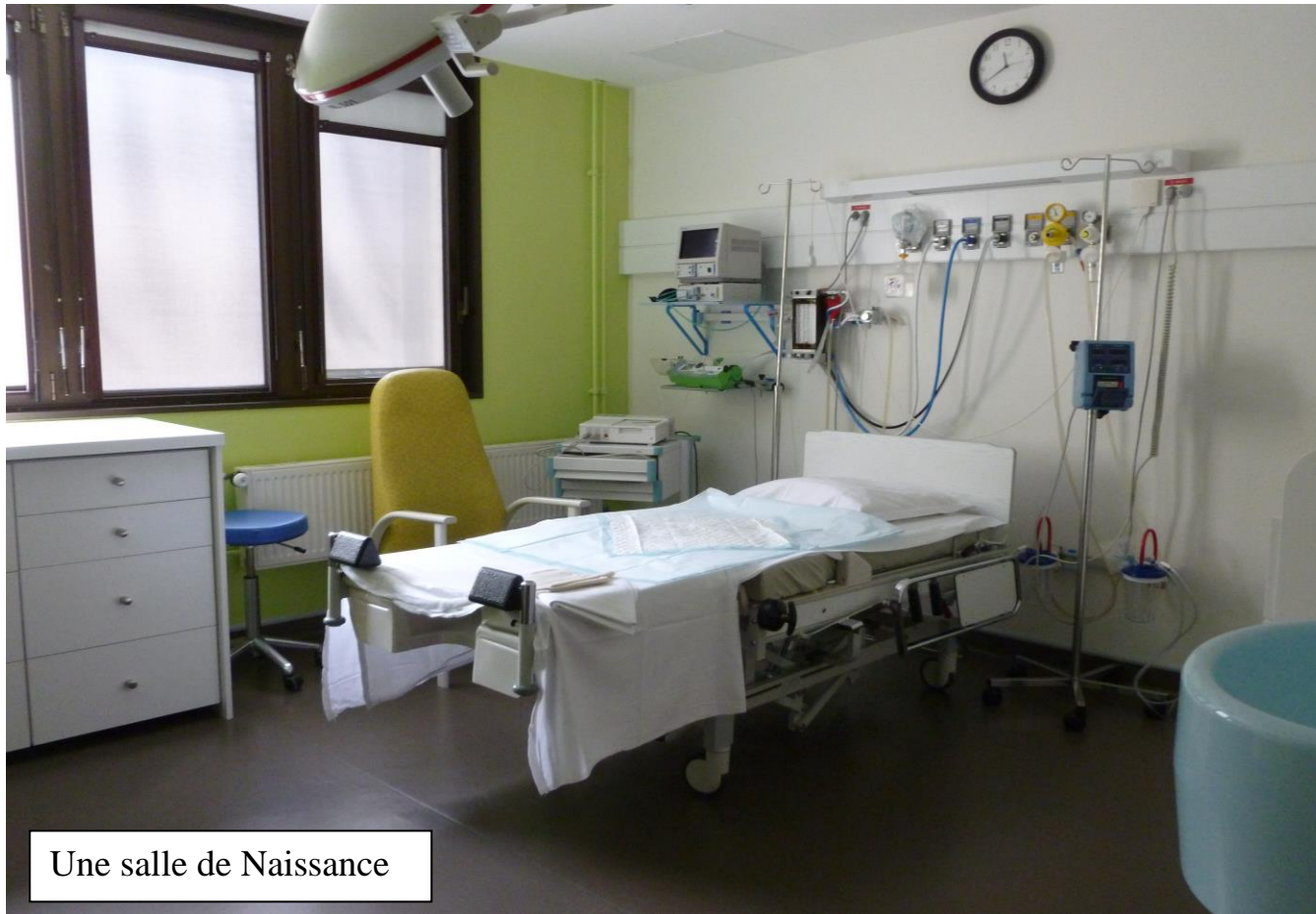
Une salle de Naissance